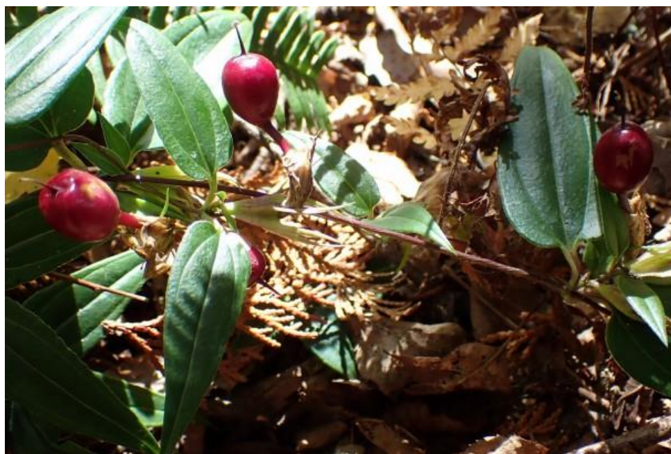
ツルリンドウの実

フデリンドウのロゼット、バイカオウレンの花、アケボノソウの花、スギヒラタケ、クチベニタケ、ツチグリ、ガンクビソウの花、シロヨメナの花、センブリの実、センボンヤリの綿毛、ツルリンドウの実、サルトリイバラの実、ヤブムラサキの実、カモシカ、猿の糞？（カラスザンショウの種入り）、イタチの糞、セアカツノカメムシ