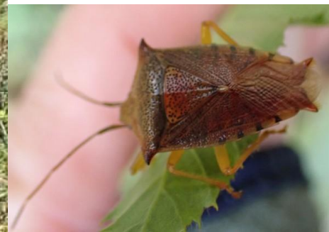
セアカツノカメムシ♂