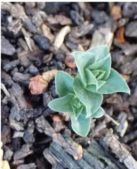
フデリンドウのロゼット