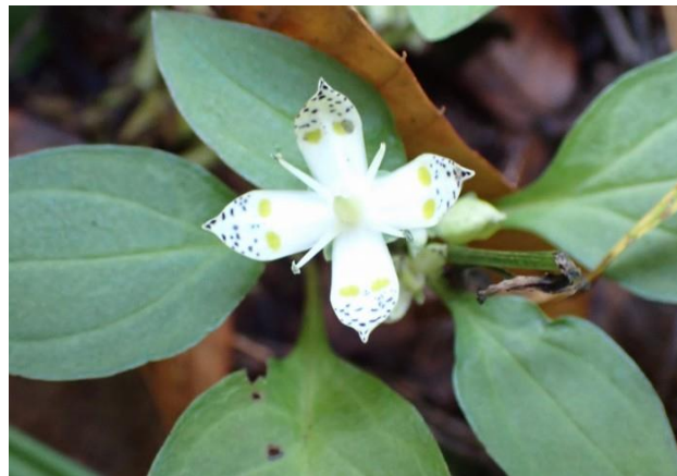
まだ咲いてたアケボノソウ